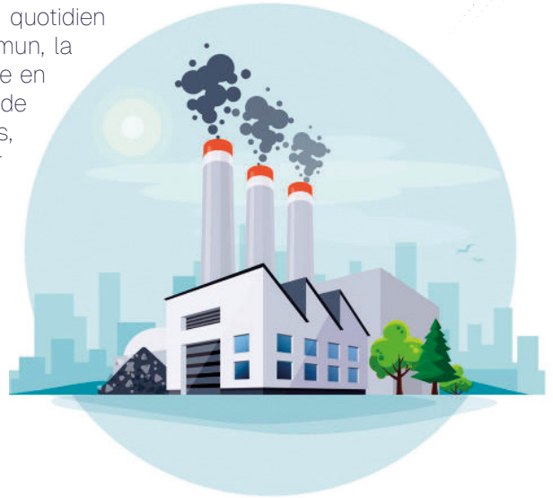
Centrale thermique au charbon

Tu peux choisir les actions qui te plaisent et qui sont possibles pour toi.