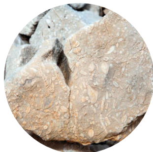
Roche à foraminifères