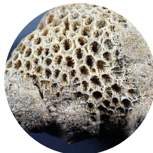
Roche à bryozoaires