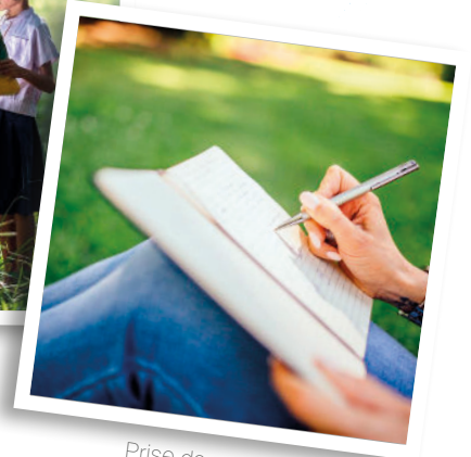
Prise de notes