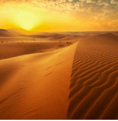
Désert chaud, Sahara