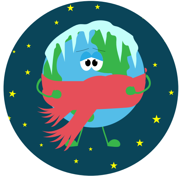
Illustration de la Terre en périodes froides

L'activité solaire, elle-même, n'est pas toujours la même et évolue avec le temps. La composition de l'atmosphère a aussi un effet majeur sur le climat à cause de l' effet de serre et cette composition a changé depuis la naissance de la Planète. On sait que lors de très grosses éruptions volcaniques la température baisse de façon visible car l'atmosphère est saturée de poussières. On sait enfin que les activités humaines influencent désormais fortement le climat . Nous allons voir cela dans la fiche suivante.