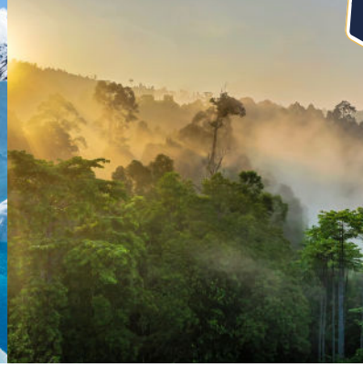
Climat tropical, forêt humide