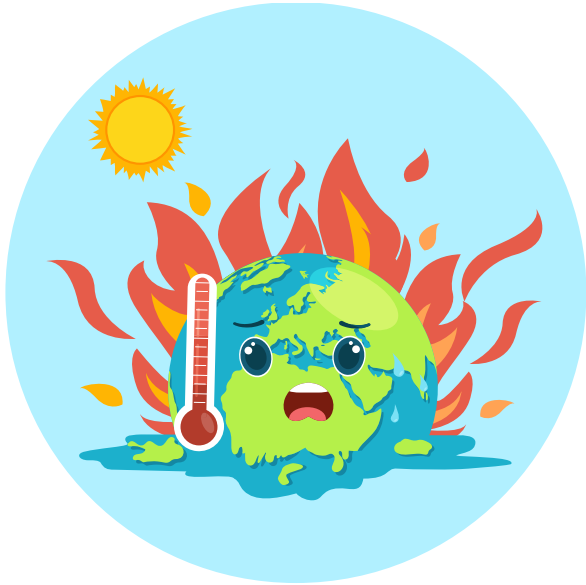
Illustration de la Terre en périodes chaudes

Ces variations du climat ont de nombreuses origines. La distance entre le soleil et la Terre et la position de la Terre par rapport au soleil évoluent de façon cyclique.