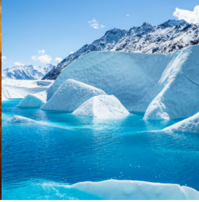
Désert froid, Antarctique