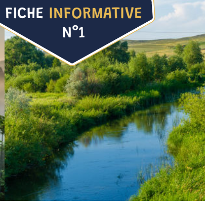
Climat tempéré, plaine d'Europe