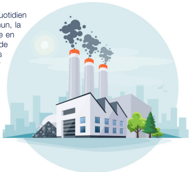
Centrale thermique au charbon

Tu peux choisir les actions qui te plaisent et qui sont possibles pour toi.