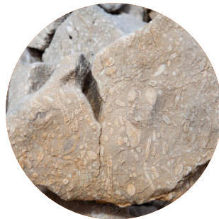
Roche à foraminifères