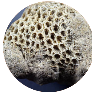
Roche à bryozoaires